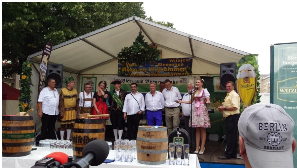
Offizielle Festivaleröffnung mit den Festivalbieren der Bier- und Burgenstraße