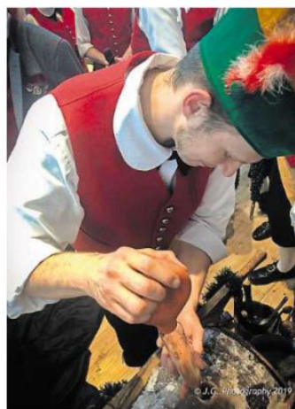
Ein voller Erfolg: Die Präsentation des Eisbocks durch die Böttner.