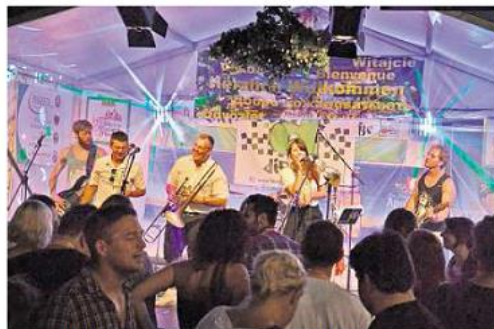
Auf dem Berliner Bierfestival brachte die Band „dieSka“ aus dem Landkreis Kronach die Bühne zum Beben und das Publikum zum Tanzen und Mitfeiern.

Und noch etwas freut den Pressiger Bürgermeister und Beirat der Bier- und Burgenstraße ganz besonders, die Band „dieSka“ aus dem Landkreis Kronach begeisterte die in-